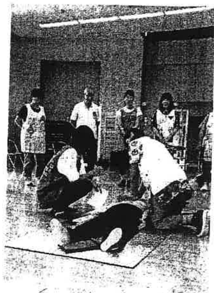
安全委員会主催 「救命救急法研修会」 AEDの使い方